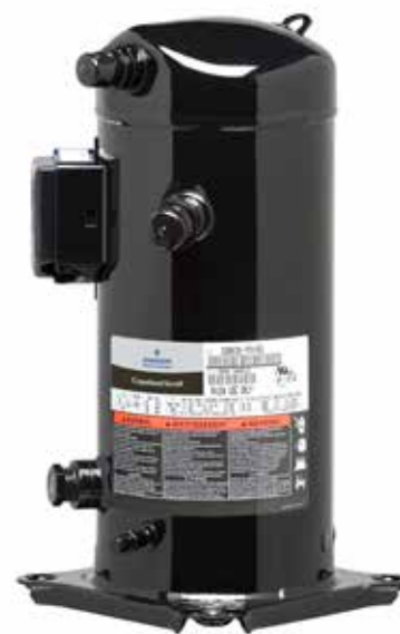
Компрессор ZO для низкотемпературного охлаждения

Серия включает восемь моделей, в том числе две модели Digital, обеспечивающие непрерывное регулирование холодопроизводительности в диапазоне от 10 до 100%.